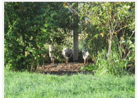
Ook de kippen zoeken de schaduw op...