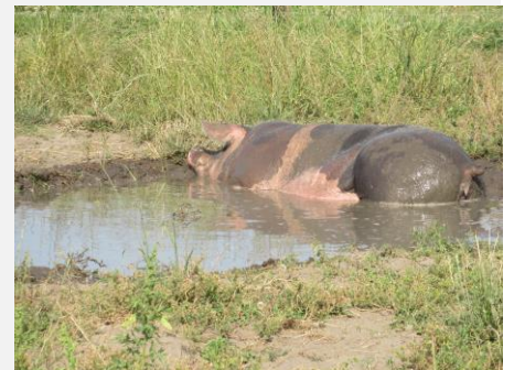
Heerlijk die modderpoel