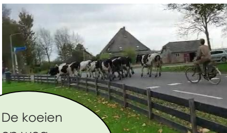
De koeien op weg naar de stal

Het is buiten nat en guur. De herfst loopt op z'n eind, de winter begint. Dat betekent dat we alle beesten op stal hebben. De koeien en varkens kunnen prima tegen de kou, maar ze hebben een hekel aan nattigheid. Ze blijven dan liever binnen. Ook daar hebben ze ruimte genoeg. Het is er warm, maar vooral droog. Bovendien is er altijd voldoende voedsel beschikbaar. Ze redden zich prima. De schapen blijven het jaar rond buiten, daar zijn ze immers het best op hun plek. Met hun wintervacht trotseren zij kou en regen. Wat dat betreft zijn het doordouwers.