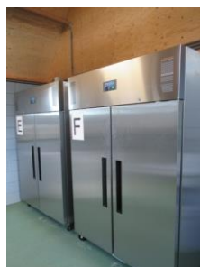
De vriezers zijn gevuld

Deze is iedere zaterdag geopend en de overige dagen van de week op telefonische afspraak.