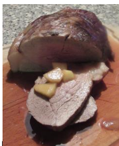
Er is weer ruime keuze in heerlijke soorten vlees

Kalfslappen zijn bij ons verkrijgbaar. Vraag er gerust naar als u onze winkel bezoekt.