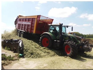
De graswagens brengen het gras van het land naar de sleufsilo