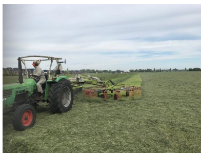
Nadat het gras is gemaaid en geschud wordt het gewierd, op rijen geveegd.