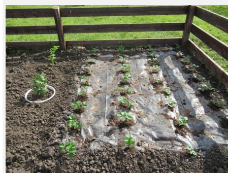
De moestuin is aangelegd. De eerste aardbeien zijn in de (s)maak.