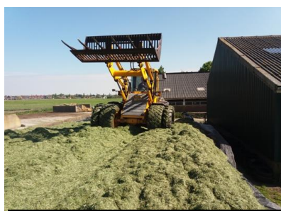
De shovel rijdt het gras steeds aan, zodat het in kan klinken en er veel gras op de kuil komt.