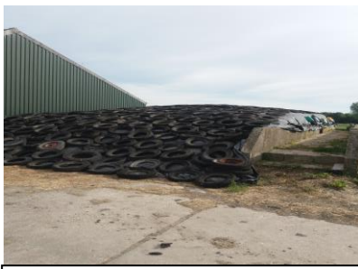
En na een dag hard werken is dit het resultaat. Een mooie wintervoorraad voor de koeien