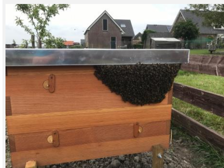
We zijn twee bijenvolken rijker. Ze settelen zich in hun kast.