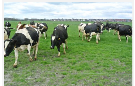
Alvast een verlangmomentje; wat is het heerlijk als al het vee weer onbekommerd naar buiten kan.