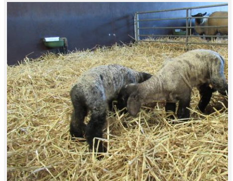
Nieuwe lammetjes 2020: Broer en zus verkennen elkaar.